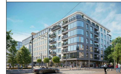
LOKAL USŁUGOWY NR 5, PARTER